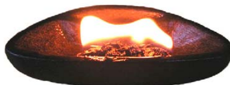
Inuit-Lampe (Qulliq) aus Speckstein